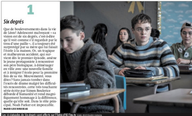
Les 13 épisodes de Six degrés sont offerts sur l'Extra 4K! Tou TV.